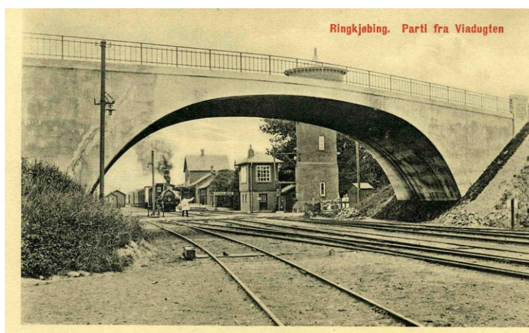
Damplokomotiv på vej mod vandtårnet

Selv hurtigtogene holdt dengang ret længe ved stationerne, i hvert fald ved købstæderne. Lokomotivet skulle hen til vandtårnet, en banemand, som vi kaldte dem der var ansat ved jernbanen, gik og slog på alle vognhjulene med en hammer, og med bagsiden af sin hånd følte han om vognakslerne var løbet varme.