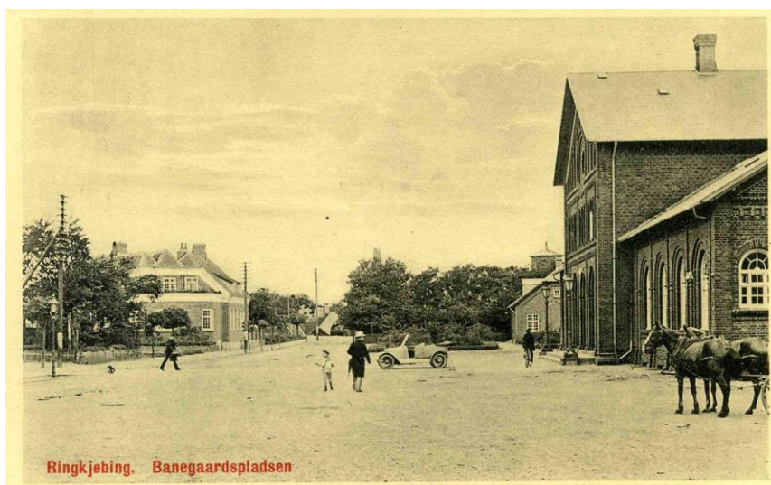
Livet foran banegården.

Stationsforstanderne var dengang ofte tidligere officerer, stramme i uniformen og ulastelige handsker, og de krævede formerne overholdt.